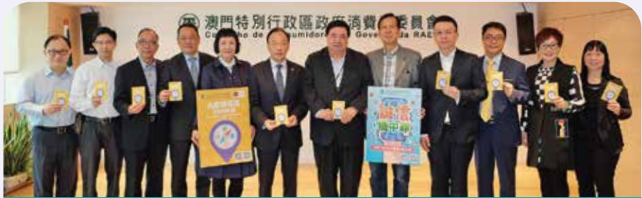
全體委員會及執行委員會出席發行儀式

Membros do Conselho Geral e da Comissão Executiva do CC estiveram presentes na cerimónia de lançamento da Guia