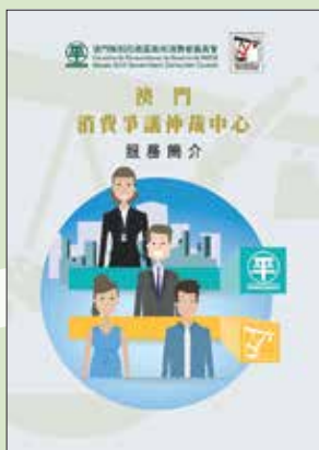
Apresentação dos Serviços do Centro de Arbitragem de Conflitos de Consumo

“消費爭議仲裁中心”於1998年成立至今二十年，本會特別出版《消費爭議仲裁中心成立二十週年紀念特刊》，以回顧“仲裁中心”的發展歷程，包括歷年重要的工作、調解與仲裁的個案數字、仲裁個案範例，以及“仲裁中心”自今年起實行跨域仲裁等內容。本會同時發行《澳門消費爭議仲裁中心服務簡介》小冊子，以漫畫形式介紹“仲裁中心”服務內容，說明“仲裁中心”具公平、裁決具法律效力、便捷與免費等優點。