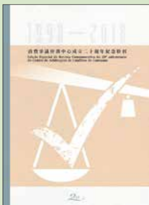
Edição Especial da Revista Comemorativa do 20º Aniversário do Centro de Arbitragem de Conflitos de Consumo