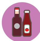
表四：調味品平均零售價及變動

Mapa IV: Preço médio e variação de preço dos condimentos