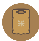
表一：米類平均零售價及變動

Mapa I: Preço médio e variação de preço do arroz