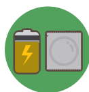
表二：生活用品平均零售價及變動

Mapa II: Preço médio e variação de preço dos mercadorias para vida quotidiana