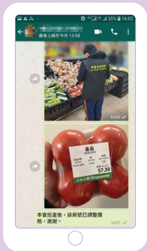
以上截圖為模擬本會收到市民舉報，及本會的跟進回覆