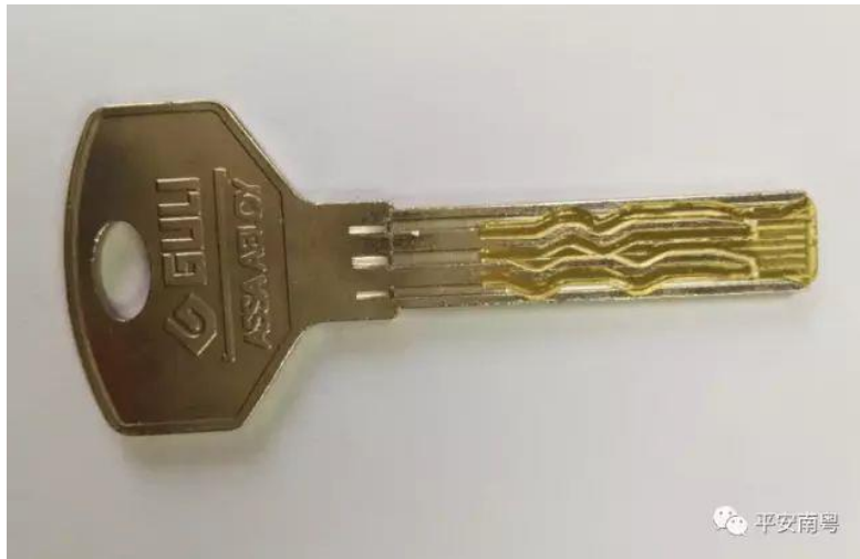
C 級 3 (平面槽六軌跡葉片)